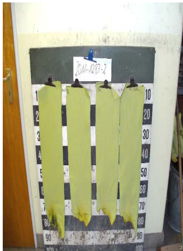
Aussehen der Probe B nach dem Brandschachtversuch