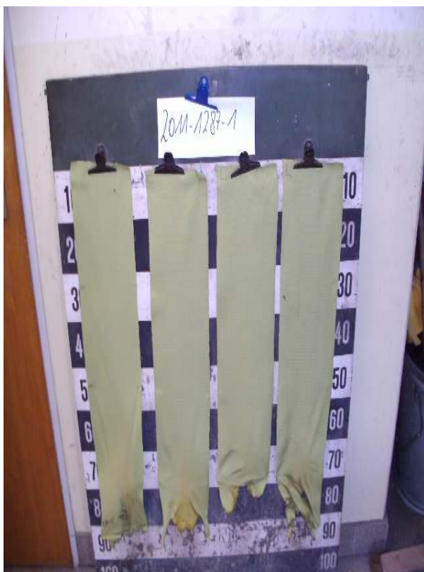
Aussehen der Probe A nach dem Brandschachtversuch